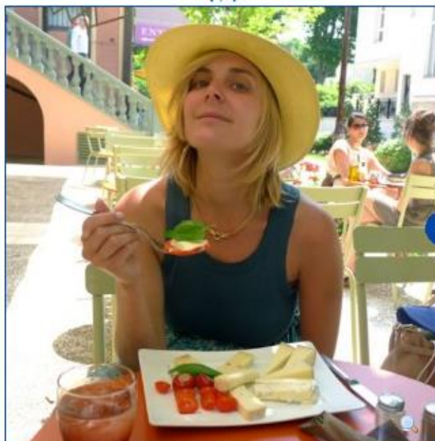
Spuntino, une trattoria canonissime